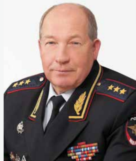
Виктор Кирьянов, Президент Российской автомобильной федерации

В сезоне 2015 года участников РСКГ ждет немало изменений. Я уверен, что новые правила позволят сделать Российскую серию еще более привлекательной как для спортсменов, так и для зрителей.