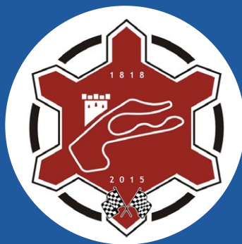
ТРАССА «ФОРТ ГРОЗНЫЙ»