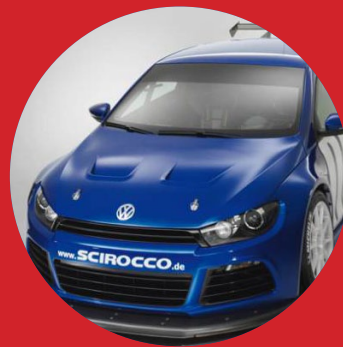
СТОК В «ПРОДАКШНЕ»

Впервые за долгое время автомобили «Лада» потеряли большинство в «Национальном» классе. Что это? Полный крах или передышка перед очередным доминированием? Пока силы разделены практически поровну. Мы уверены: борьба окажется жаркой и будет за кого поболеть.