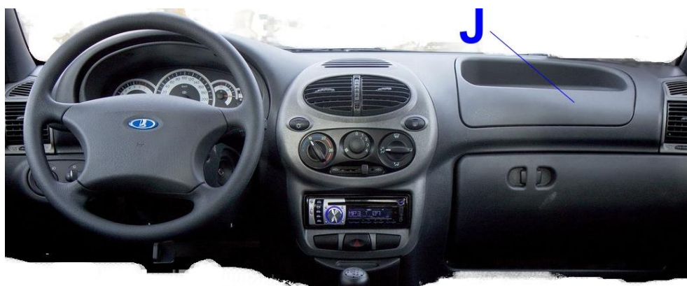
Рис. 4 Схема расположения обязательных наклеек на приборной панели, в зоне onboard камеры.