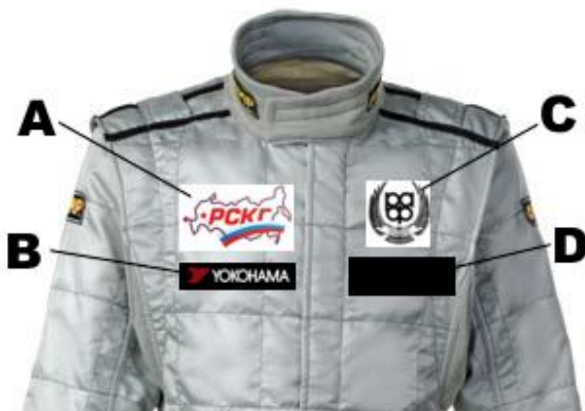
Рис. 1. Схема расположения спонсорских нашивок на комбинезоне пилота.