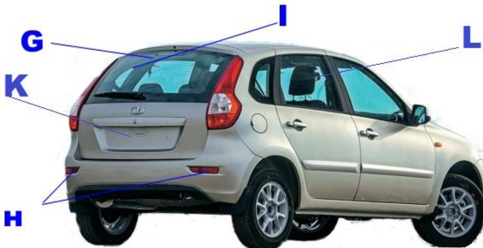
Рис. 3 Схема расположения обязательных наклеек на автомобиле. Вид \frac{3}{4} сзади.