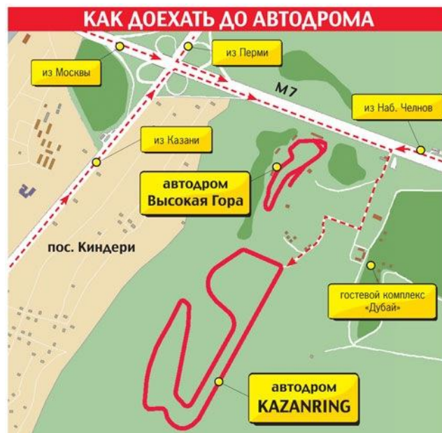
Рис.2. Как добраться до автодрома «Казань Ринг»

На территории автодрома установлены боксы размером 7 x 18 м. Высота ворот со стороны пaddock – 4.2 м, со стороны питлейна – 2.8 м. Боксы не разделены перегородками.